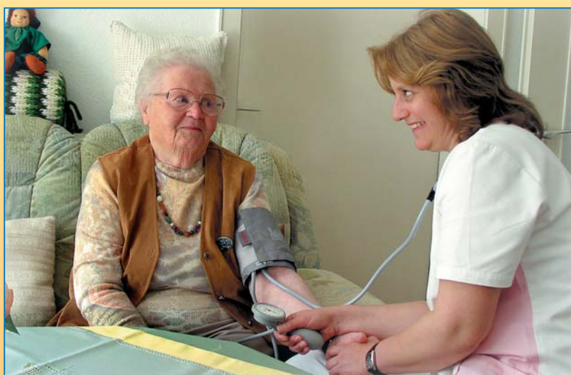
Stimmt der Blutdruck?

Gerne versorgen wir Sie auch während Ihres Urlaubes in Bad Salzuflen!