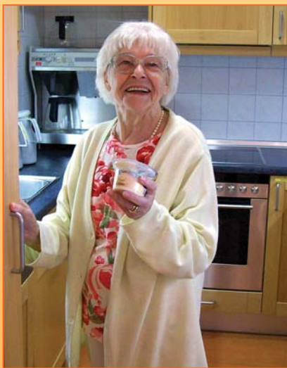
Wo man sich wohlfühlt, ist man zuhause!

In allen Wohngruppen gibt es eine großzügig ausgestattete Wohnküche für gemeinsame Mahl-