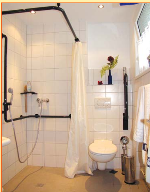
Barrierefreie Badezimmer nach neusten Standards in den Seniorenwohnungen am Stiftsweg.

vielen attraktiven Angebote des Stiftes in Anspruch zu nehmen. 39 Appartements befinden sich in den günstigen Seniorenwohnungen am Stiftsweg. Mietvoraussetzung ist hier der Wohnberechtigungsschein.