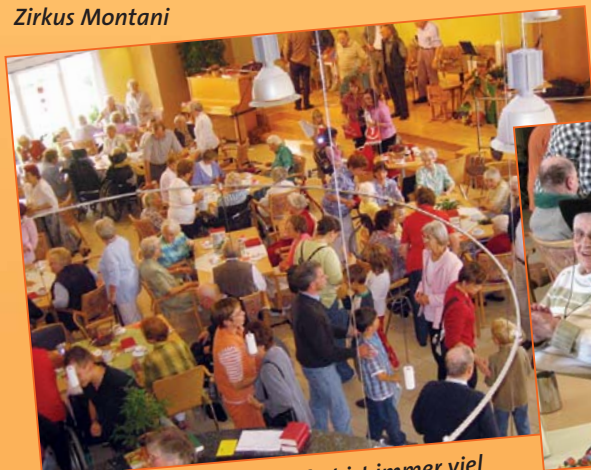
Beim jährlichen Stiftungsfest ist immer viel Betrieb.

Der Sozialdienst bietet ein Beschäftigungsprogramm, mit dem versucht wird, den unterschiedlichsten Interessen gerecht zu werden. Dazu gehören unter anderem das Sitztanzen und das Gedächtnistraining.