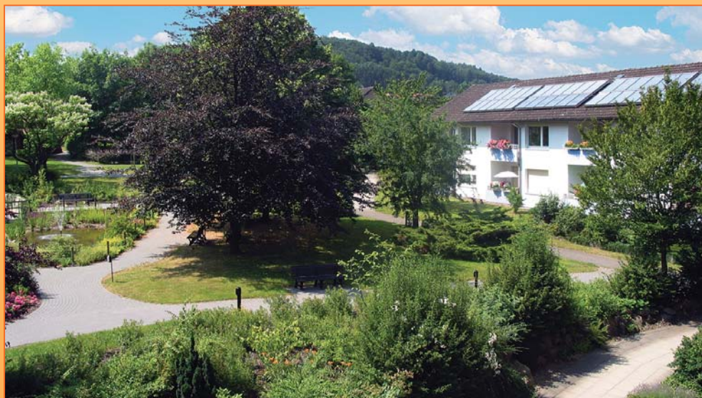
Schonung von Ressourcen wird im Stift großgeschrieben: Solaranlagen versorgen die Brauchwasseranlage mit Energie und senken so die Kosten für die Bewohner der Seniorenwohnungen am Stiftsweg.

An der Langenbergstraße 16 liegen sechs weitere Wohnungen im ehemaligen Mitarbeiterhaus. Sie bieten den Bewohnern einen Ausblick in den grünen und blühenden Stiftspark.