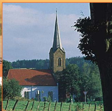
Die Wüstener Kirche