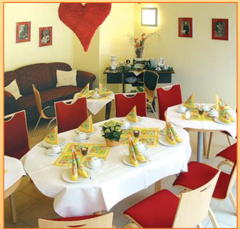
Unser „Café am Lindenhof“