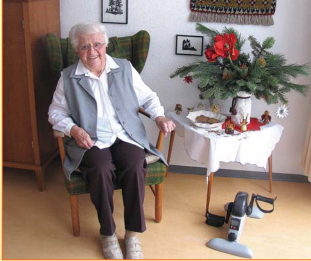
Die gemütlichen Zimmer können mit eigenen Möbeln und Bildern gestaltet werden.

Die individuelle und kompetente Betreuung und Pflege, die auf die persönlichen Bedürfnisse unserer Bewohner abgestimmt ist, erhält und fördert die Selbstständigkeit. In kleinen Wohngruppen bieten