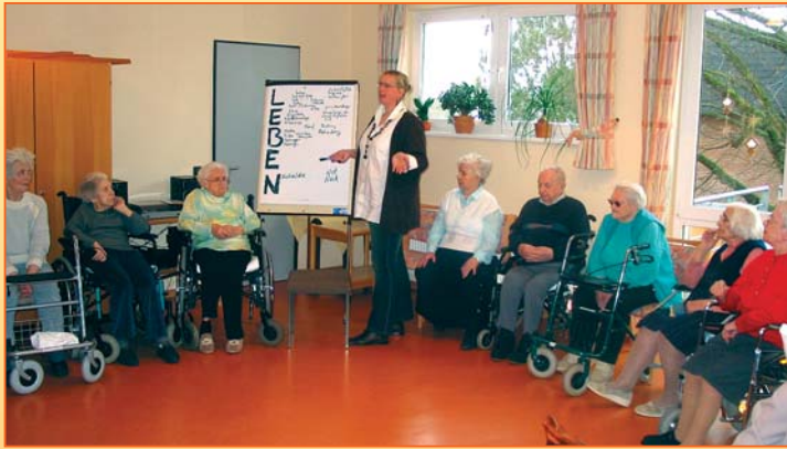
Die Mitarbeiterinnen des Sozialdienstes kümmern sich um die soziale Betreuung unserer Bewohner und sorgen für ein buntes Veranstaltungsprogramm.

wir 122 Pflegeplätze in Einzel- und Doppelzimmern auch bei schwerster Pflegebedürftigkeit. Die persönliche Gestaltung der eigenen Zimmer wird von uns gefördert.