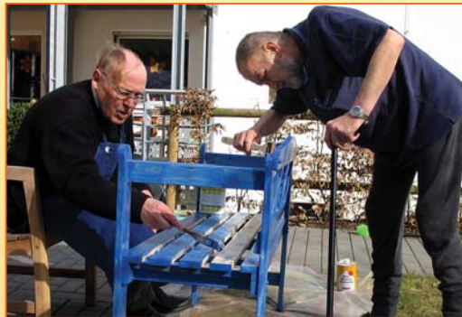
... oder das Streichen einer Sitzbank sein.