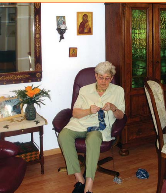
Die geräumigen Zwei-Zimmer-Wohnungen bieten viel Platz auch für eigene Möbel.

Die Mieter der Seniorenwohnungen versorgen sich in der Regel selbst. Sie kochen, waschen und erledigen ihren Haushalt. Bei Bedarf kann die Pflege und die Versorgung mit Essen durch unseren ambulanten Dienst erfolgen.