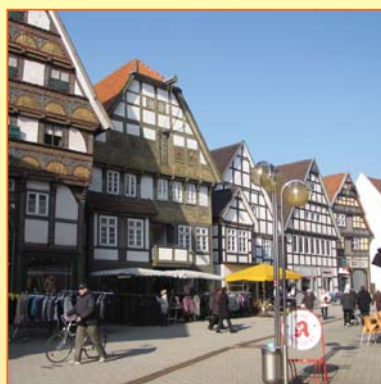
Der historische Stadtkern mit attraktiven Einkaufsmöglichkeiten

Bekannt durch seinen Reichtum an heilsamen Solequellen, bietet das ehemalige Salzsiederstädtchen Luft und Wasser wie an der See. Der historische Stadtkern beeindruckt mit prächtigen Patrizierhäusern und kunstvoll verzierten Fachwerkbauten. Hier lässt es sich wunderbar bummeln und verweilen. Der große Kur- und Landschaftspark macht Bad Salzuflen besonders attraktiv.