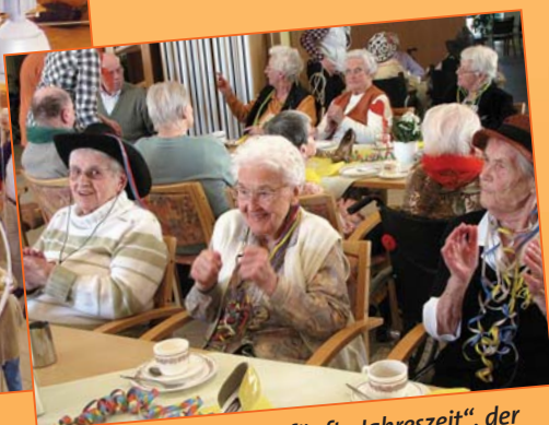
Auch im Stift wird die „fünfte Jahreszeit“, der Karneval, farbenfroh und ausgelassen gefeiert.