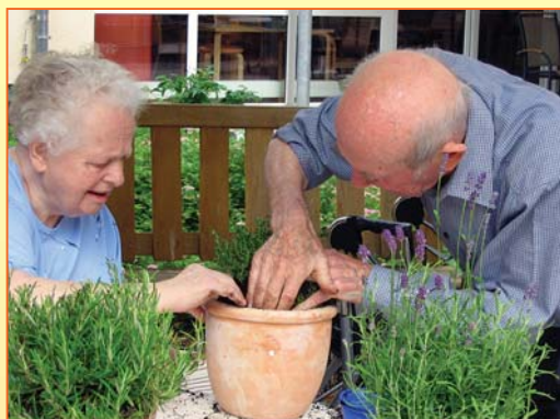
Auch die gemeinsame Arbeit ist Teil der Betreuung. Dies kann das Eintopfen von Blumen ...