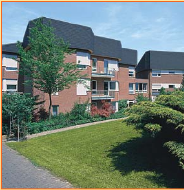
Das Zuhause im „Betreuten Wohnen“ ist auch von außen ein Blickfang.

bedürftigkeit - rund um die Uhr - zur Verfügung steht. Jedes Appartement ist an das hausinterne Notrufnetz angeschlossen, so dass in Notsituationen sofort qualifiziertes Personal für Sie da ist.