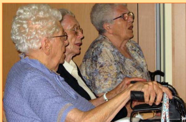
Lieder zum Mitsingen sorgen für fröhliche Stimmung ...

In unseren großzügig gestalteten Räumen bieten wir mit einer Vielzahl von Veranstaltungen Abwechslung für fast jeden Geschmack. Von Großveranstaltungen wie dem Stiftungsfest über das monatliche Tanzcafé bis zu therapeutischen Gruppenangeboten möchten wir das „Leben im Alter“ angenehm gestalten. Zu den vielseitigen Angeboten gehören auch „Restaurantabende“ wie „Spargelrestaurant“, „Kartoffelabend“ oder „Pickertessen“, die Küche und Sozialdienst gemeinsam organisieren.