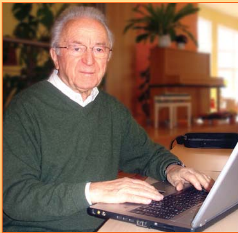
Internetcafé im Stiftscafé

kann. Im Stiftscafé kann man per Funk im Internet surfen. Im Internetcafé führen ehrenamtliche Dozenten in die Geheimnisse von PC und Web ein. Die Seminare bieten wir allen Interessenten der Umgebung an, die auch zu festen Öffnungszeiten die Computer gegen eine geringe Gebühr nutzen können. Auch ein Friseur-salon bietet im Stift seine Dienste an.