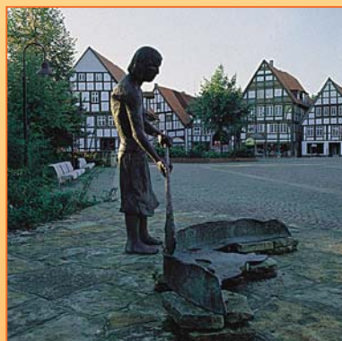
Bad Salzuflens Innenstadt bietet viele sehenswerte Kulissen

Die Bad Salzufler Innenstadt ist schnell mit dem Stadtbus erreicht.