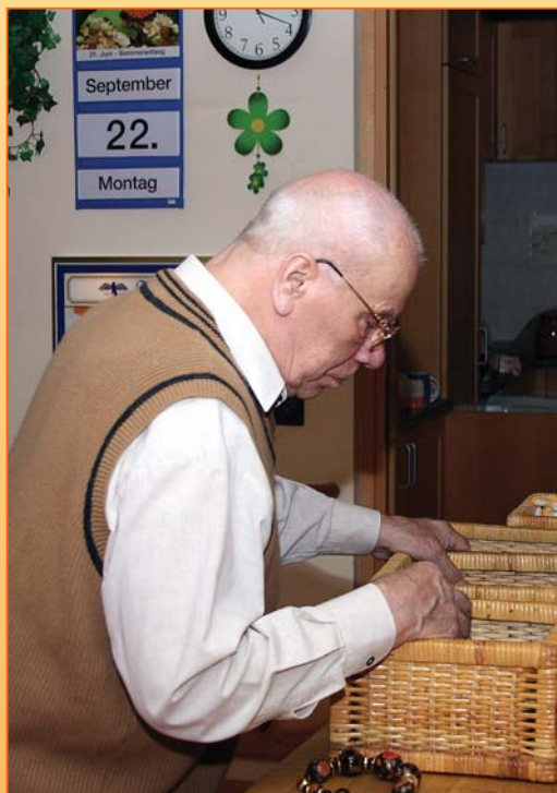
„Kramkisten“ laden zum Durchstöbern ein.

Bei der pflanzlichen Gestaltung werden die Bewohner mit beteiligt.