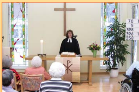
Beim wöchentlichen Gottesdienst finden im Andachtsraum auch Rollstuhlfahrer genügend Platz.