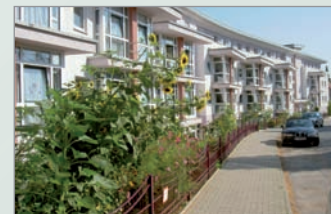
Pflegebereich Lichterfelder Ring, Steglitz