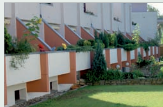
Haus Lichterfelder Ring, Steglitz

Lichterfelder Ring 197, 12209 Berlin-Lichterfelde