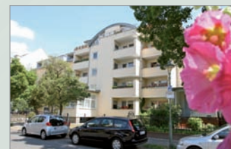
Haus Plantagenstraße, Steglitz