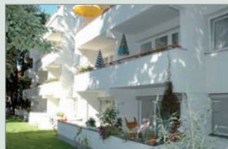
Haus Heerstraße, Charlottenburg