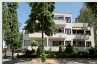
Haus Weinheimer Straße, Wilmersdorf