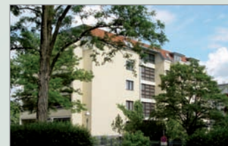
Haus Akazienallee, Westend