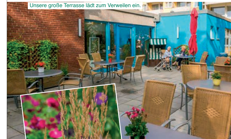
Unsere große Terrasse lädt zum Verweilen ein.

Hier ist jeder, der teilnehmen möchte, herzlich willkommen.