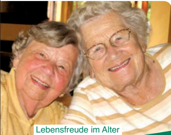
Lebensfreude im Alter

Auch wer im Alter mit gesundheitlichen Einschränkungen leben muss, soll dennoch auf Lebensqualität nicht verzichten.