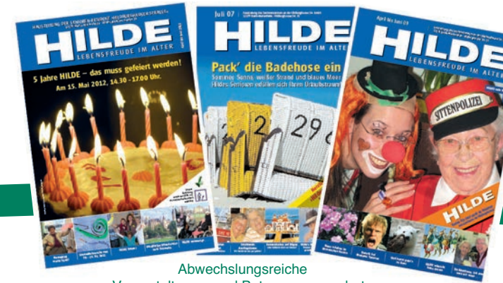
Abwechslungsreiche Veranstaltungs- und Betreuungsangebote

Gartenanlagen mit Spazierwegen, Rezeption mit großer Lobby, sowie Club-, Therapie- und Gymnastikräume runden das Raumangebot ab.