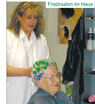
Frisörsalon im Haus

Unser Küchenteam erfüllt unseren Bewohnern und Gästen auch gerne besondere kulinarische Wünsche.