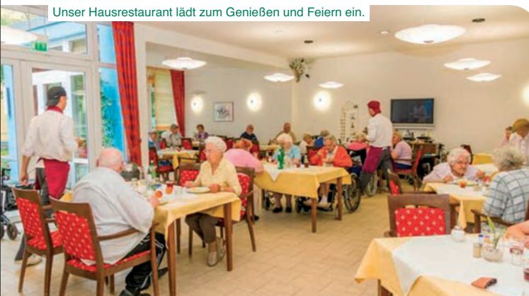
Unser Hausrestaurant lädt zum Genießen und Feiern ein.

Wer seinen Lebensabend aktiv, sicher, in Geborgenheit und in einem gepflegten Ambiente verbringen möchte, findet hier einen Alterssitz, der Menschlichkeit und Wärme vermittelt.