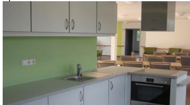
Wohnküche Ebene 4