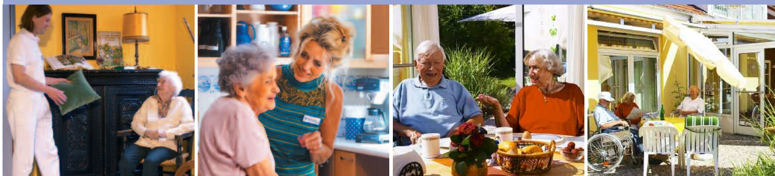
Von links nach rechts: Bild 1: Das freundliche, hilfsbereite Personal der AEH kümmert sich um Ihre Gesundheit. Verschiedene Haus- und Fachärzte sind regelmäßig zur Behandlung vor Ort. Bild 2: Ein Stück Lebensqualität – die leckere Küche im Albertinum. Bild 3: Die Gottesdienste und Andachten sind stets gut besucht. Wir laden Sie herzlich ein. Bild 4: In der Aquarellmalgruppe können Sie Ihre Kreativität entfalten.