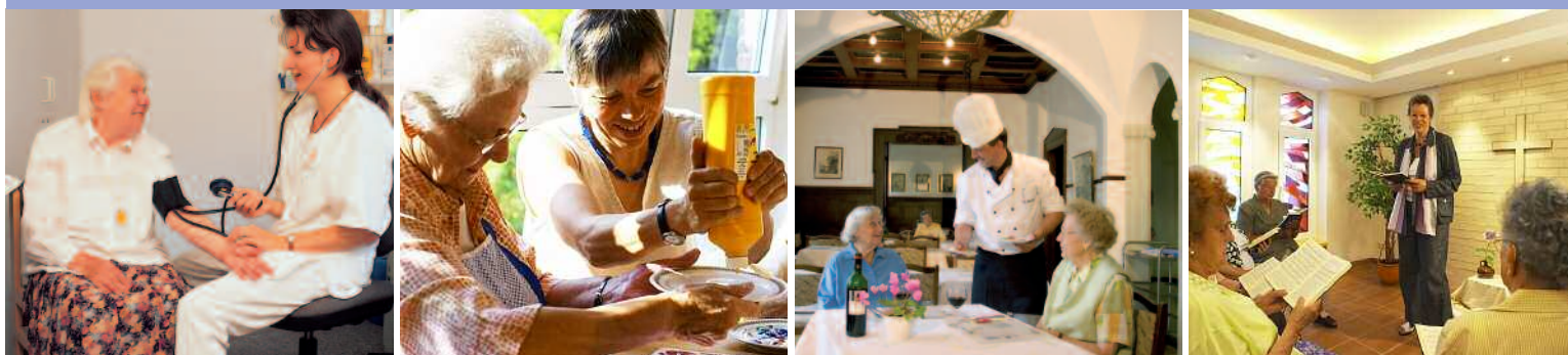
Von links nach rechts: Bild 1: Die eigene Wohnung: Hier sind Sie zu Hause. Bild 2: Die hauseigene Bibliothek, auch »Bücherturm« genannt, bietet eine breite Auswahl an Literatur. Bild 3: Unabhängig und selbstbestimmt leben. Sich einfach wohl fühlen. Bild 4: Der anheimelnde Kamin: Ein beliebter Treffpunkt. Unten: Beispielgrundriss für ein 1 1/2-Zimmer-Appartement.