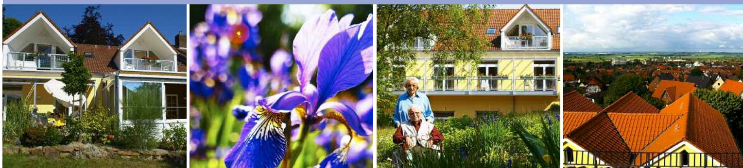
Von links nach rechts: Bild 1: Hier können Sie viele Sonnenstunden genießen: Nahezu jedes unserer Apartments verfügt über einen eigenen Balkon oder eine eigene Terrasse. Bild 2: Der weitläufige, gepflegte Garten wird gern zu Aufenthalten im Freien genutzt. Bild 3: Fernab vom Straßenlärm bietet sich ein wundervoller Blick ins Grüne. Bild 4: Unsere große Terrasse ist ein Platz zum Entspannen in netter Gesellschaft.