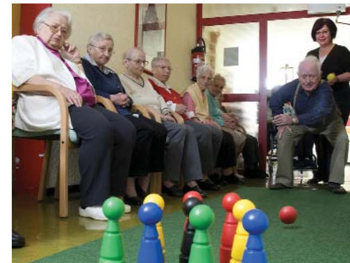
Besonders beliebt: Vielfältige Freizeitangebote wie Kegeln und gemeinsame Spielerunden.