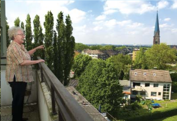
Wunderschöne Aussicht: Viele Bewohnerinnen und Bewohner genießen den Blick weit über die Stadtgrenzen hinaus.

Verkehrsgünstig im attraktiven Essener Stadtteil Kray gelegen, bietet Ihnen das Altenzentrum Kray eine angenehme Wohn- und Pflegeeinrichtung mit einer Vielzahl seniorengerechter Angebote.